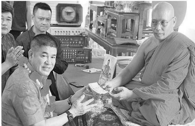
ทอดผ้าป่า - ร.อ.ธรรมนัส พรหมเผ่า รชช.เกษตรและสหกรณ์ เป็นประธานฝ่ายฆราวาสพิธีทอดผ้าป่าสามัคคีเพื่อบูรณะปรับปรุงศาลาหลวงพ่อดำ ที่วัดทรายขาว จ.นราธิวาส เมื่อวันที่ 23 พฤศจิกายน

จากนั้น ร.อ.ธรรมนัส พร้อมคณะ เดินทางไปยังวัดล้าฎ อ.เมืองนราธิวาส เพื่อร่วมทอดผ้าป่าสามัคคี เพื่อสมทบทุนบูรณะซ่อมแซมกำแพงและซุ้มประตูวัดล้าฎ พร้อมเข้าเยี่ยมชมนิทรรศการ หลวงพ่อก้าวข้ามโซโต โดยมีนายอำเภอเมืองนราธิวาส กำนัน ผู้ใหญ่บ้าน และประชาชนในพื้นที่ร่วมต้อนรับ