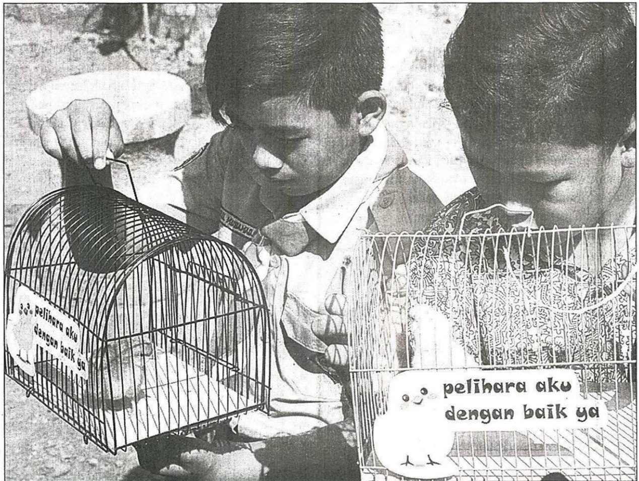
เด็กนักเรียนในเมืองบंदได้รับมอบลูกเจียไปเลี้ยงคนละหนึ่งตัว (เอเอฟพี)

พิธีตัดริบบิ้นเปิดโครงการมอบลูกเจียให้นักเรียนนำไปเลี้ยง ที่โรงเรียนแห่งหนึ่งในเมืองบंदเมื่อวันพฤหัสบดีที่ผ่านมา โดยมีลูกเจียหลายสิบตัวใส่ไว้ในกรงเหล็กเล็กๆ กรงละตัว พร้อมป้ายที่เป็นรูปตัวการ์ตูนลูกเจียและภาษาอินโดนีเซียเขียนว่า "โปรดดูแลมันอย่างดี"